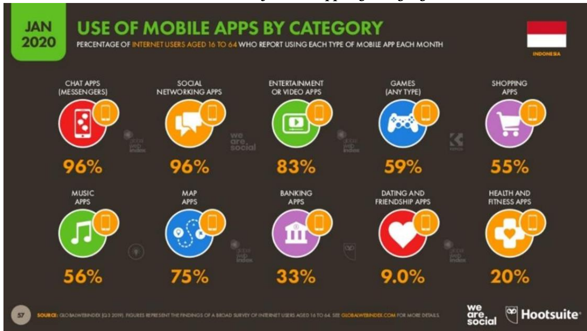
Gambar 1. Use of Mobile Apps by Category