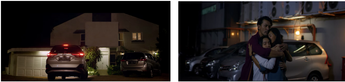
Gambar 2. Adegan Penempatan produk pada “NKCTHI”