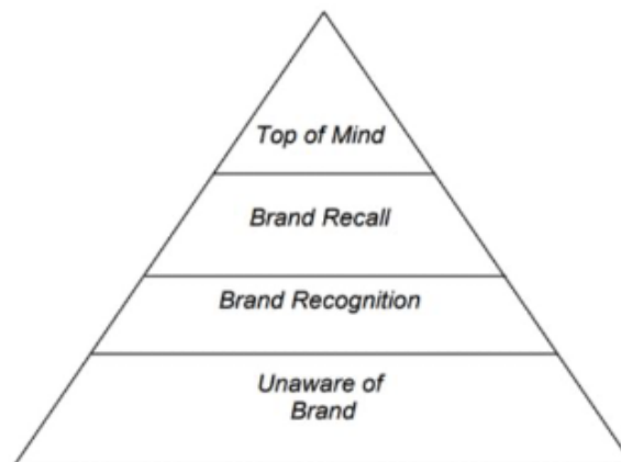
Gambar 3. Piramida Brand Awareness

Berdasarkan Aaker (dalam Glanfield, 2018), kemampuan pembeli dalam mengenali atau mengingat sebuah merek tertentu dinamakan sebagai kesadaran merek. Kesadaran merek adalah dasar untuk membangun ekuitas merek. Kesadaran merek menurut Aaker (dalam Kristanto & Karina, 2016) memiliki beberapa level untuk mengukur kesadaran konsumen: (1) top of mind (pikiran teratas), pada level ini konsumen mengingat sebuah merek dari merek-merek lainnya yang ada dalam kategori sama; (2) brand recall (mengingat merek), konsumen dapat mengingat merek tanpa bantuan atau secara langsung pada level brand recall . (3) brand recognition (pengenalan merek), pada tingkatan ini konsumen dapat mengidentifikasi merek setelah dibantu untuk mengingat merek tersebut; dan (4) unaware of brand (tidak mengetahui merek), dalam hal ini konsumen tidak mengenali merek.