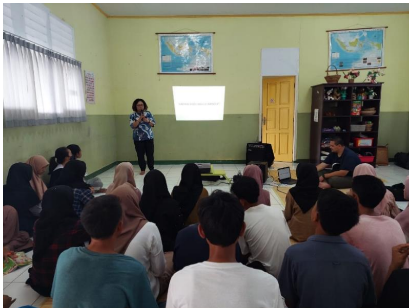
Gambar 3. Literasi Media di CLC Rembitan

Kegiatan pengabdian kepada masyarakat berupa sosialisasi tentang literasi media ini mendapat antusiasme yang baik dari peserta remaja di CLC Rembitan dan Pemenang. Seperti yang telah dijelaskan pada bagian metode pelaksanaan, penulis memberikan materi berupa konsep-konsep pemahaman mengenai media sosial, seperti gambaran umum mengenai media sosial, fungsi media sosial, dan dampak dari media sosial, Gambaran umum dan fungsi dari media sosial dapat memberikan pemahaman awal bagi remaja mengenai apa itu media sosial dan apa yang bisa mereka lakukan dengan media sosial. Bahkan pada sesi ini, peserta dengan cepat dan mudahnya dapat memberitahukan pada penulis media sosial apa yang sering mereka gunakan dan apa yang mereka lakukan dengan media sosial tersebut. Media sosial yang mereka gunakan, antara lain Facebook, Instagram, Snapchat, dan TikTok.