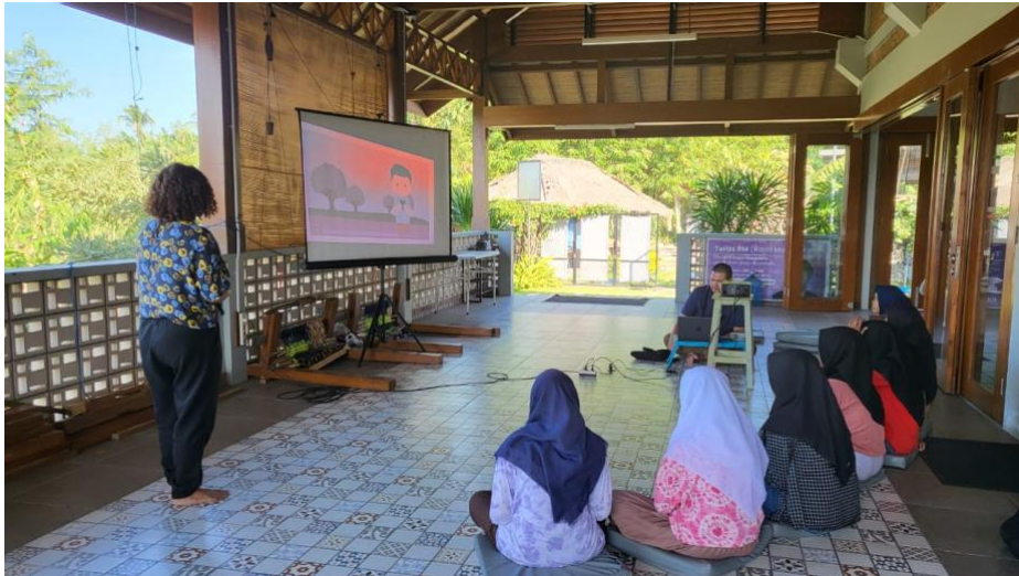
Gambar 4. Literasi Media di CLC Pemenang