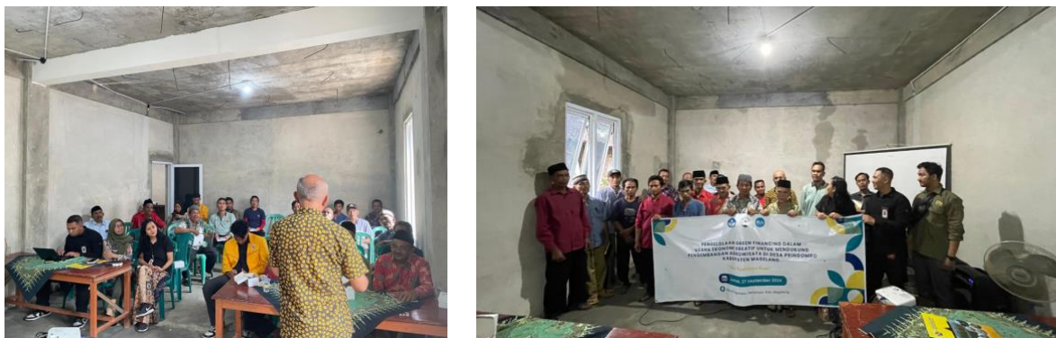
Gambar 3. Dokumentasi kegiatan sesi diskusi dan pemaparan materi budidaya kopi

Kegiatan pertama dilakukan sesi diskusi dan pemaparan materi selama dua jam lebih yang dilaksanakan pada tanggal, 27 September 2024, dimana kegiatan tersebut meliputi, pemaparan materi/diskusi tanya jawab mengenai budidaya kopi terkhusus jenis kopi robusta, menjelaskan tentang macam-macam batang pohon yang harus dijaga atau dipangkas, diskusi mengenai pemilihan tunas yang baik, menjelaskan mengenai warna kopi yang baik untuk dikonsumsi, dan diakhiri dengan penyerahan sertifikat serta foto bersama dalam ruangan.