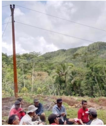
Gambar 2. Kegiatan FGD dan survey potensi desa

Di Desa Pringombo terdapat kelompok tani masyarakat yang bernama LMDH Payung Ridho Illahi di mana lembaga ini menaungi masyarakat yang bermatapencarian tani dan mendapatkan penghasilan dari hasil bumi. Tim telah melakukan observasi dan focus group discussion (FGD) kepada para pelaku UMKM dan petani kopi di Desa Pringombo yang berada di bawah keanggotaan lembaga masyarakat tersebut. Hasil observasi dan FGD menunjukkan bahwa aspek pemasaran dan manajemen keuangan masih menjadi permasalahan bagi usaha yang dijalani. Hingga saat ini, pemasaran yang dilakukan pelaku UMKM dan petani kopi hanya terfokus pada Kota dan Kabupaten Magelang. Hal ini menjadi salah satu penghambat keberlanjutan dan pengembangan usaha. Di sisi lain, lemahnya pengelolaan manajemen keuangan yang tidak terstruktur turut menjadi permasalahan lain yang dirasakan oleh pelaku UMKM dan petani kopi.