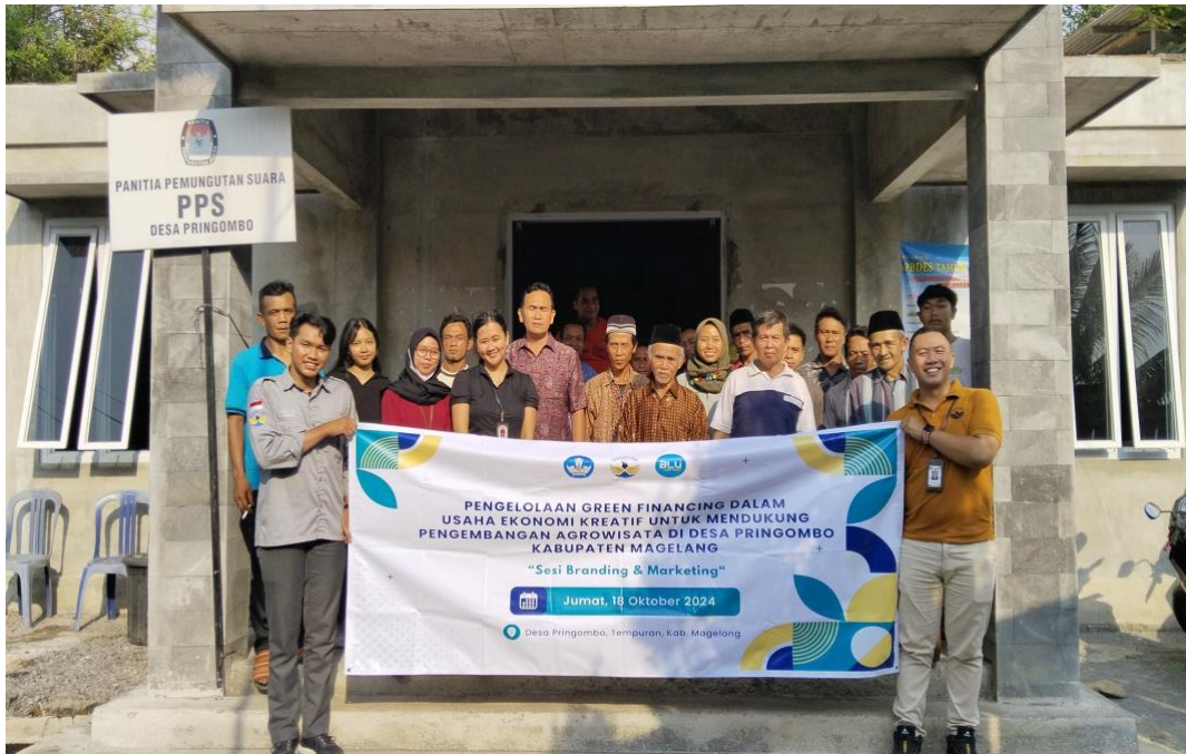
Gambar 6. Dokumentasi kegiatan branding dan marketing