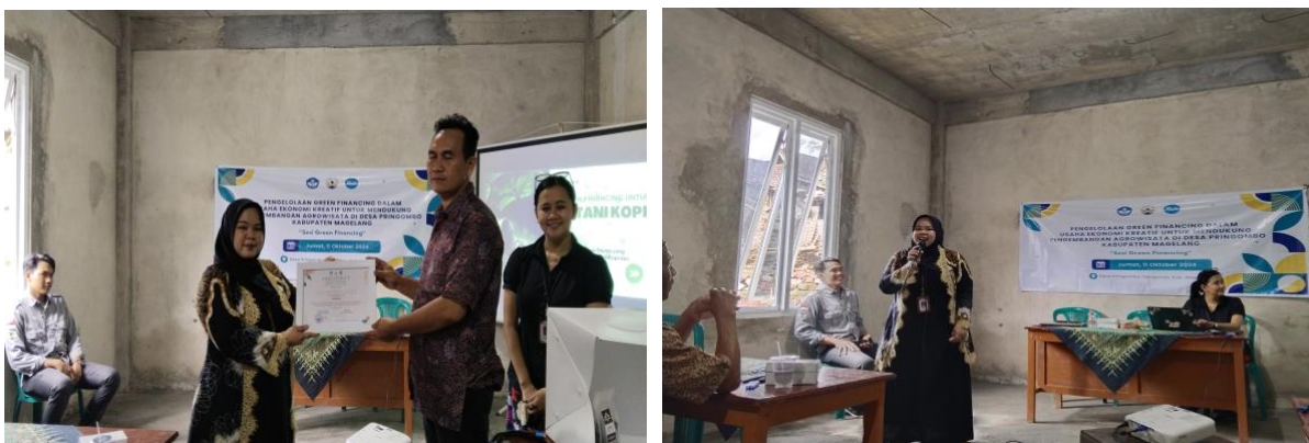
Gambar 5. Kegiatan sesi green financing

Kegiatan ketiga yaitu kegiatan yang cukup substansial yaitu sesi “ Green Financing ” yang dilaksanakan pada 11 Oktober 2024 di Balai Desa Pringombo dengan dilakukannya pemaparan materi yang cukup komprehensif sebagai bekal pemahaman dan pengamalan yang dapat diaktualisasikan dalam prakteknya. Dimana dipaparkan untuk mengenali macam macam marketing bank, dikenalkan terkait produk-produk bank, serta besaran bunganya setiap tahun, dan dijelaskan juga bagaimana urgensi mengetahui pengelolaan keuangan yang sehat dan perencanaan yang baik untuk usaha perkopian. Kemudian seperti apa peranan sektor terkait untuk pengembangan ekonomi kreatif (Lembaga Keuangan, Pemerintah). Dimana hal ini diharapkan dapat memperkuat proses pengelolaan usaha ekonomi yang lebih terstruktur.