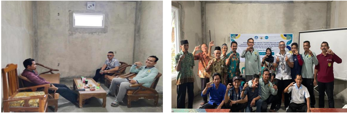
Gambar 4. Kegiatan pelatihan peningkatan kualitas kopi

Kegiatan ketiga yaitu kegiatan yang cukup substansial yaitu sesi “ Green Financing ” yang dilaksanakan pada 11 Oktober 2024 di Balai Desa Pringombo dengan dilakukannya pemaparan materi yang cukup komprehensif sebagai bekal pemahaman dan pengamalan yang dapat diaktualisasikan dalam prakteknya. Dimana dipaparkan untuk mengenali macam macam marketing bank, dikenalkan terkait produk-produk bank, serta besaran bunganya setiap tahun, dan dijelaskan juga bagaimana urgensi mengetahui pengelolaan keuangan yang sehat dan perencanaan yang baik untuk usaha perkopian. Kemudian seperti apa peranan sektor terkait untuk pengembangan ekonomi kreatif (Lembaga Keuangan, Pemerintah). Dimana hal ini diharapkan dapat memperkuat proses pengelolaan usaha ekonomi yang lebih terstruktur.